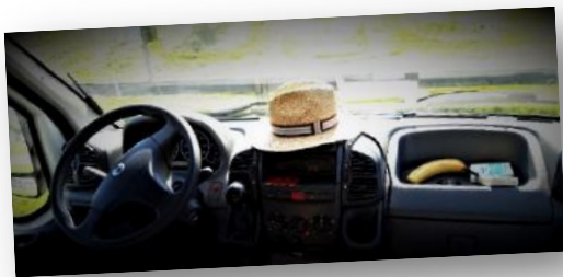
Parkering i Kristinehamn