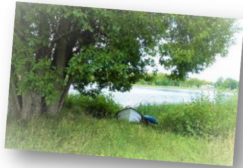
Båt på stranden vid Hunsnäsen, Eksjö