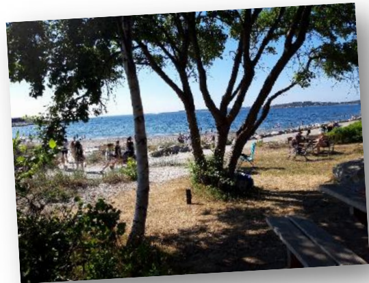
Västkusten i Frillesås, Halland.