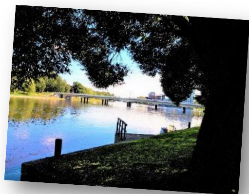
Klarälven i Karlstad.

Styrelsen i din länsförening / Jönköpings län.