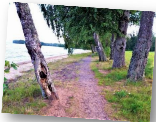
Vätten-strand i Brevik norr om Hjo