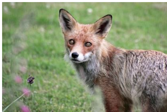
Att se och lyssna!

OBS! Senare i höst arrangerar föreningen tillsammans med Tf -Jönköping medlemsmöte