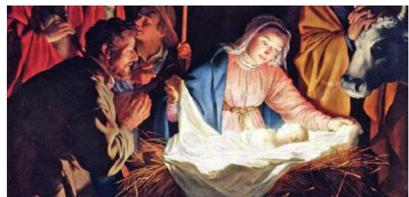
Jesusbarnet i krubban.

I varje hjärta armt och mörkt sänd du en stråle blid, en stråle av Guds kärleks ljus i signad juletid!