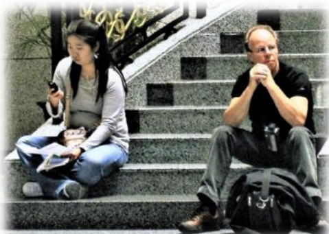
En kort paus på en trappa i National Museum i Shanghai.

För 15 år sedan, 24 november 2007 i Shanghai, Kina, ringer jag och gratulerar min dotterdotter på hennes 9-årsdag. Som morfar berättade jag för henne att här går solen strax ner och det blir kväll. Men i Sverige var det samtidigt bara morgonstund, det tyckte hon lät lite väl konstigt, (det var ju bara morgon i hennes värld).