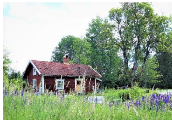
Röd liten stuga i försommartid.