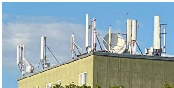
Mikrovågsstrålning från sändare och master.

Hon avslutar att texten är hennes egna ord, medans mejlet har hennes son skrivit ner, då hon inte kan använda dator (p.g.a. elöverkänslighet).