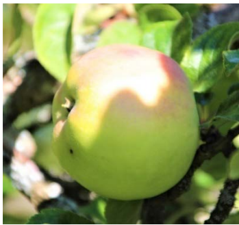
Skördetid i september månad.

För dej som känner att du vill medverka till stöd, hör av dej till mej så tar vi upp det i styrelsen. Detta är inget nytt, vi i styrelsen behöver kompetens och frivillig hjälp av fler medlemmar, för att vara en aktiv och drivande förening i viktiga frågor. / Egon R.