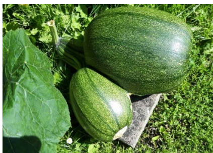
”Siamesisk pumpa”.