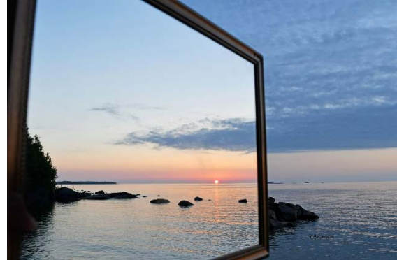
"Att se möjligheter". Bild: Yvonne Adamson

som visar om den trådlösa funktionen är AKTIVERAD I DIN HÖRAPPARAT... / Egr.