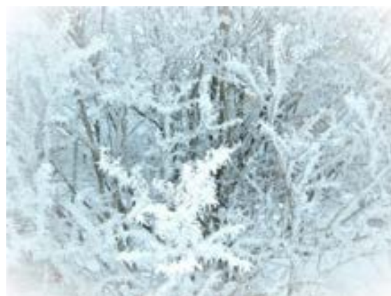
Rimfrost i adventstid.

Förhoppningsvis kan denna mötesform även i fortsättningen vara bra alternativ, (även efter Coronapandemin, då det spar både tid och merkostnad). / Egon R.