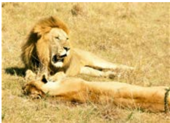
”Lejonkungen” med sin lejonhona, siesta på savannen i Kenya.