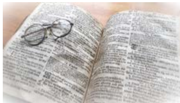
Gammaldags läsning vid juletid.