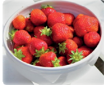
En av sommarens smaker.

En av sommarens begivenheter är jordgubbar, blåbär, hallon, björnbär och alla andra sommarbär och grönsaker som växer på våra små täppor. Inget är självklart, för många kan det vara tvärtom en bristvara eller saknad och möjlighet till egen täppa i sin vardag.