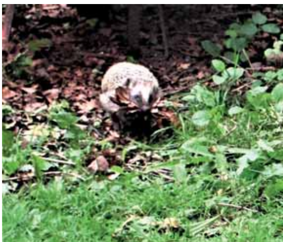
Full fart att samla in löv till boet.

Några veckor senare fick vi se hennes igelkott-ungar, som kommit ut i gröngräset utanför boet. Försiktigt kunde vi stå och iaktta dem, så spännande och kul.