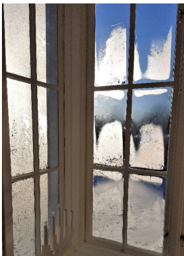
Frostiga fönster.