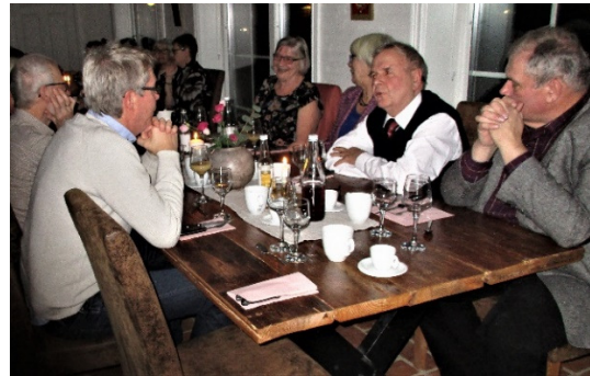
Trivsel vid borden.

Ordförande hälsade alla välkomna, tillsammans hade vi en trevlig gemenskap med god mat, underhållning och liten klurig frågetävling som Ingrid och Kjell ordnat. Att umgås i en lugn "strålningsfri miljö" är viktigt för alla och så viktigt för dem som annars har det svårt att ha tillgänglighet i restaurangmiljö.