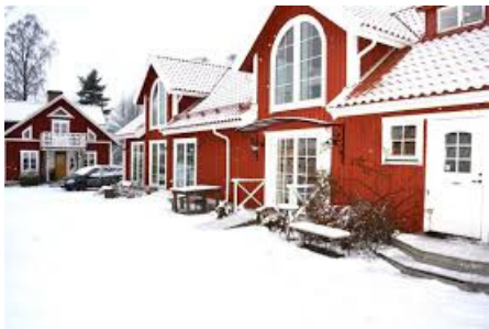
Restaurang och gårdsbutik, Norrby Ängar.

Årets sista medlemsmöte ägde rum på en ekologisk gård med gårdsrestaurang. 22 medlemmar hade mött upp till en händelserik afton med god mat och underhållning av tre musikanter från vår länsförening.