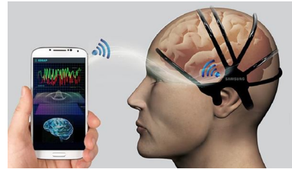
Bild: Samsung working on Mobile-Device Control by User Brain

Samsung meddelade att fonden kommer att göra utbetalningar till arbetare och deras familjer som blivit sjuka vid arbetade i Samsungs fabriker och hos underleverantörer. Fonden kommer också att fördela medel för att utveckla metoder för att förbättra arbetares säkerhet.